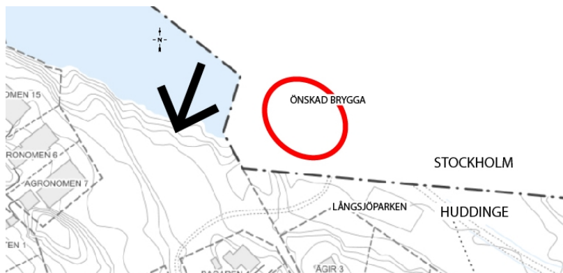
Fig. 2. Bilden visar platsen där förslagsställaren önskar en brygga inringat med rött. Pilen visar den del av stranden som tillhör Huddinge kommun och där kommunstyrelsens förvaltning bedömer det som allt för kuperad för att en säker och tillgänglig badplats ska kunna anläggas.

Huddinge kommun äger stranden väster om kommungränsen. Men Kommunstyrelsens förvaltning gör bedömningen att terrängen där är allt för kuperad för att kunna inrymma en säker och tillgänglig badplats (se Fig. 2).